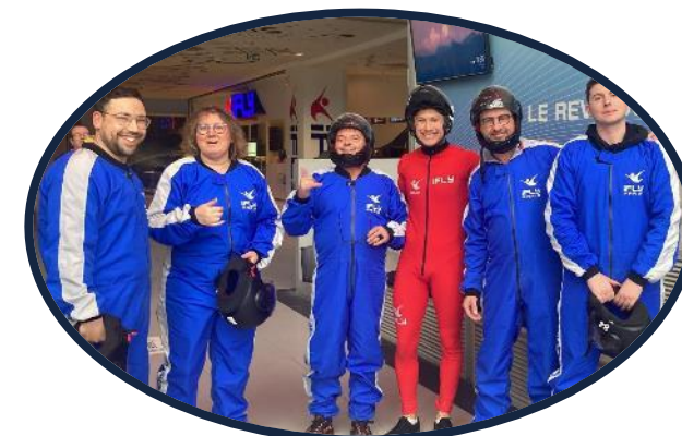
Une partie de l'équipe, lors d'une sortie chute libre en soufflerie