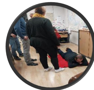
Equipe admin en formation SST