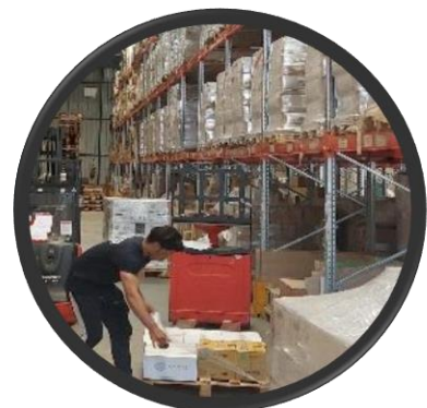
Hussein est préparateur de commande chez Flutrans. Nous lui avons permis de prendre des cours de français langue étrangère et d'avoir des revenus stables en CDI